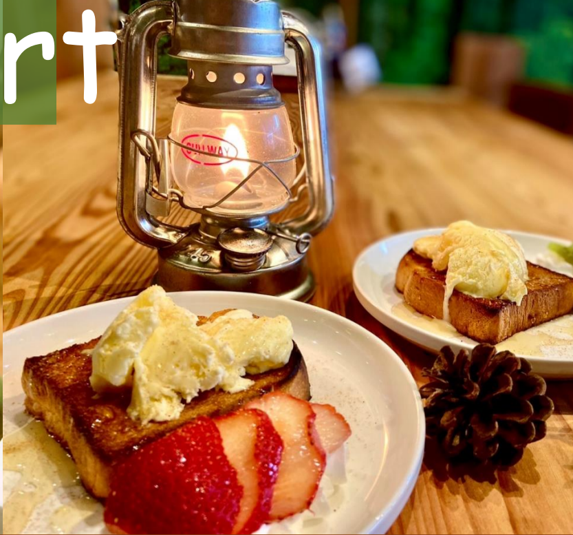
ハニーバニラトースト 400円