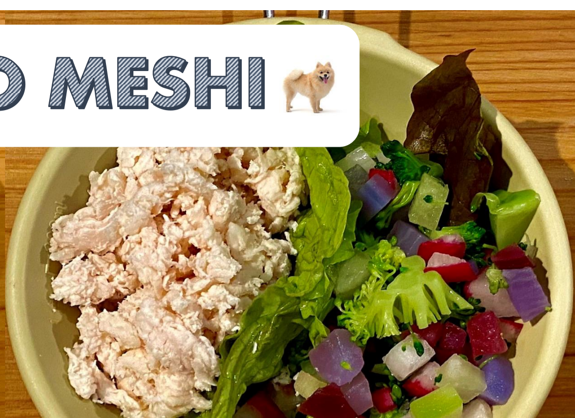
ジャックプレート ササミ40g × ベジ40g 500円