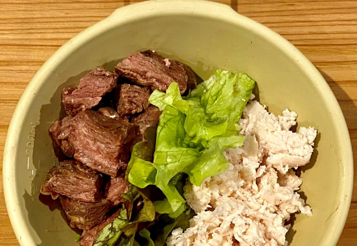
キングプレート ササミ40g × ぎゅう40g 750円