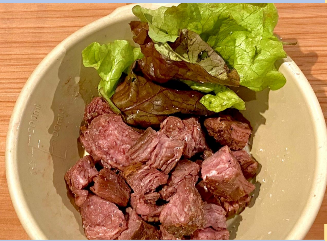
ぎゅう 40g 450円