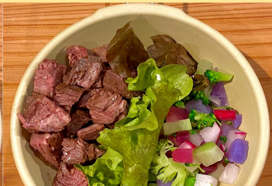
クイーンプレート ぎゅう40g × ベジ40g 600円