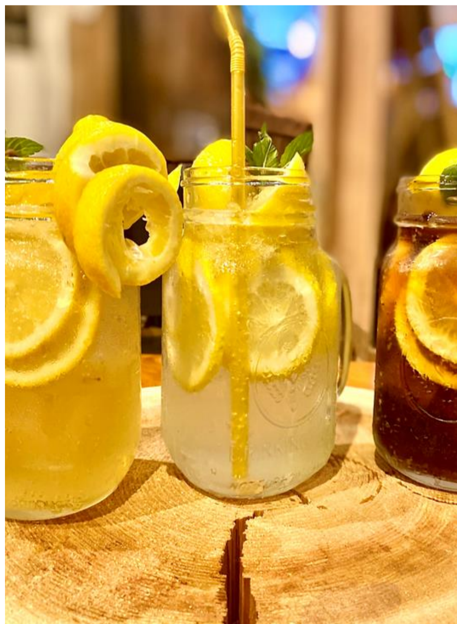
写真: 丸絞りレモンソーダ3種