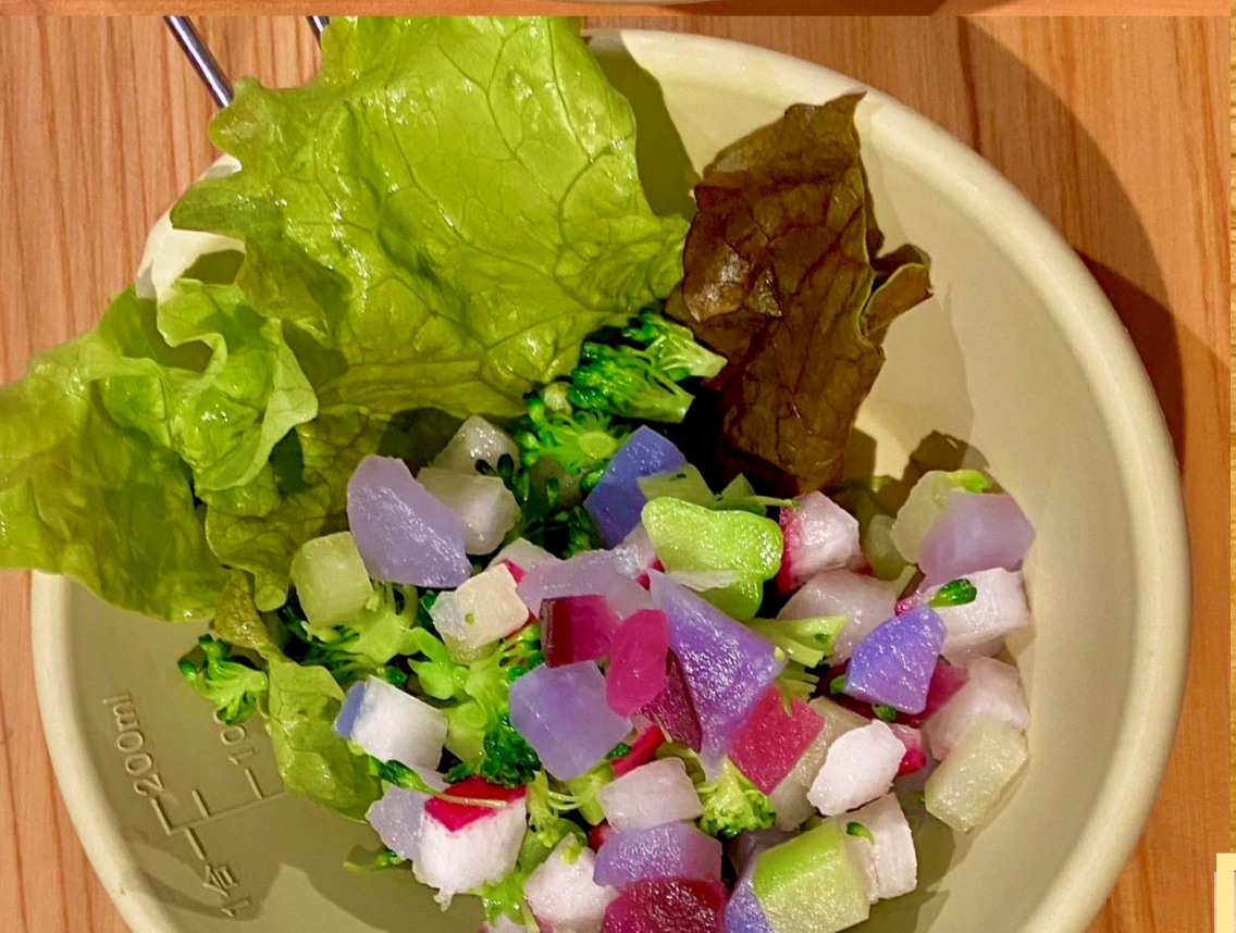
ベジ 40g 350円