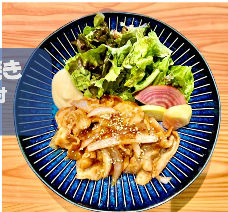
豚の生姜焼き ライス・スープ付 890円