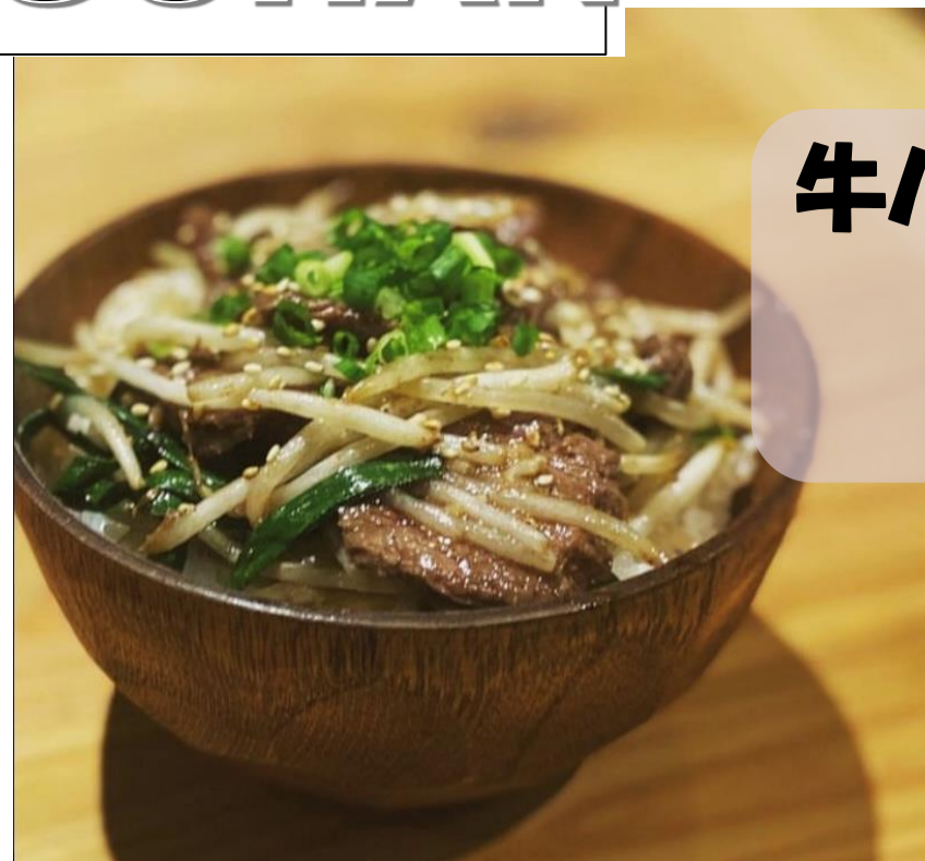
牛ハラミ焼肉丼 650円