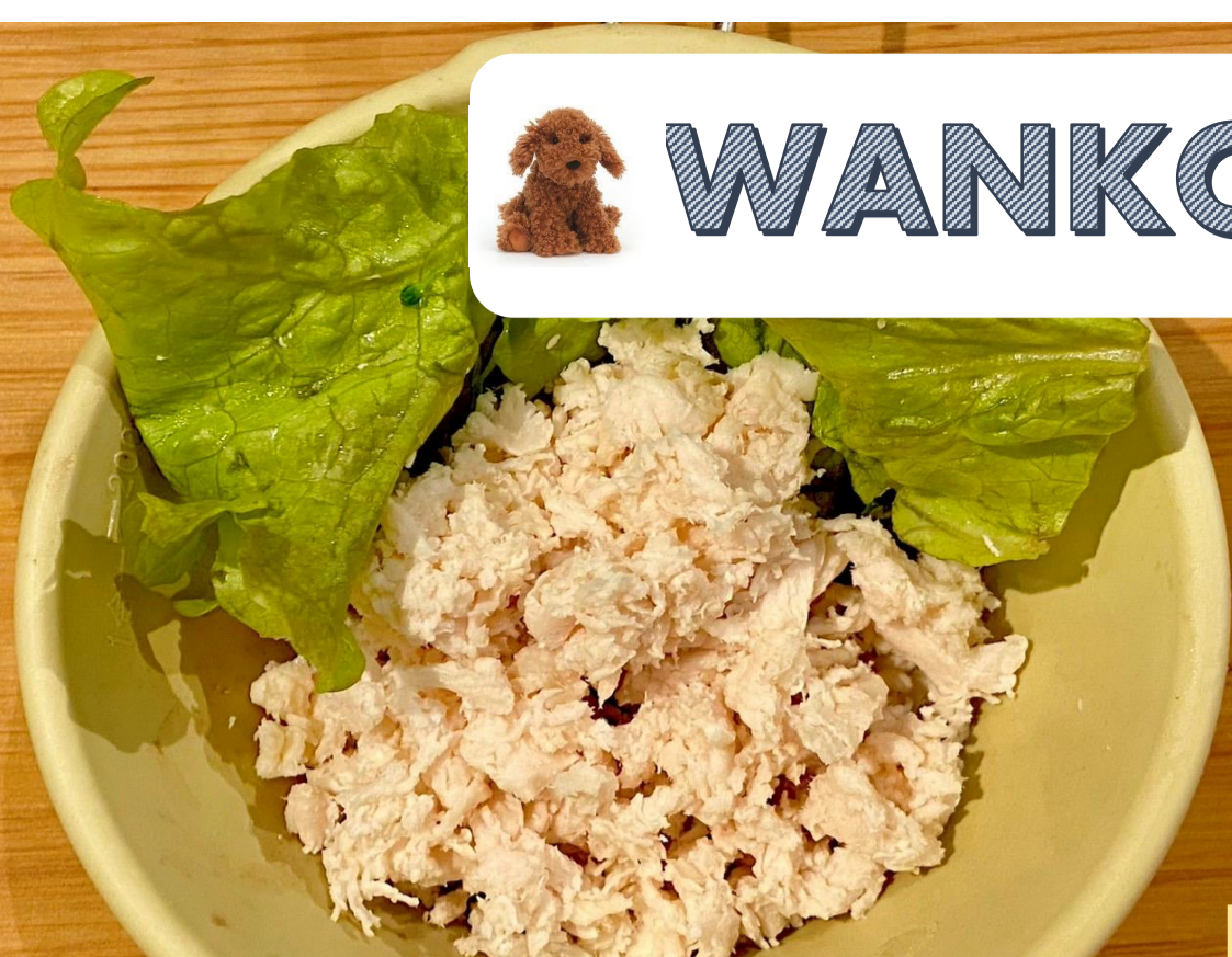
ささみ 40g 350円