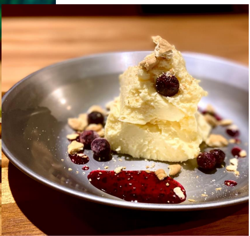
ざっくりチーズケーキ 480円