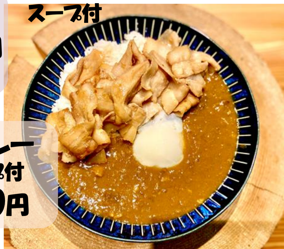
スタミナカレー スープ付 970円